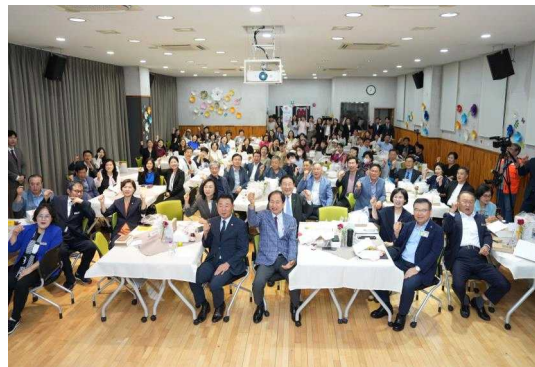
사랑의샘터 ECB 20주년 기념행사