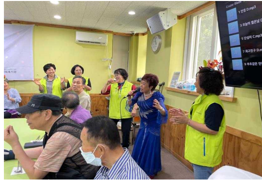
경로식당 봉사활동(컵과일 나눔, 배식봉사)