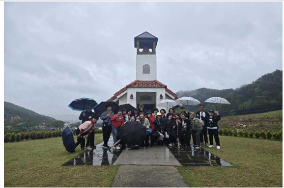
문화탐방(강원도 홍천 수타사 일대)