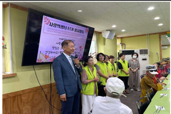
경로식당 봉사활동(컵과일 나눔, 배식봉사)